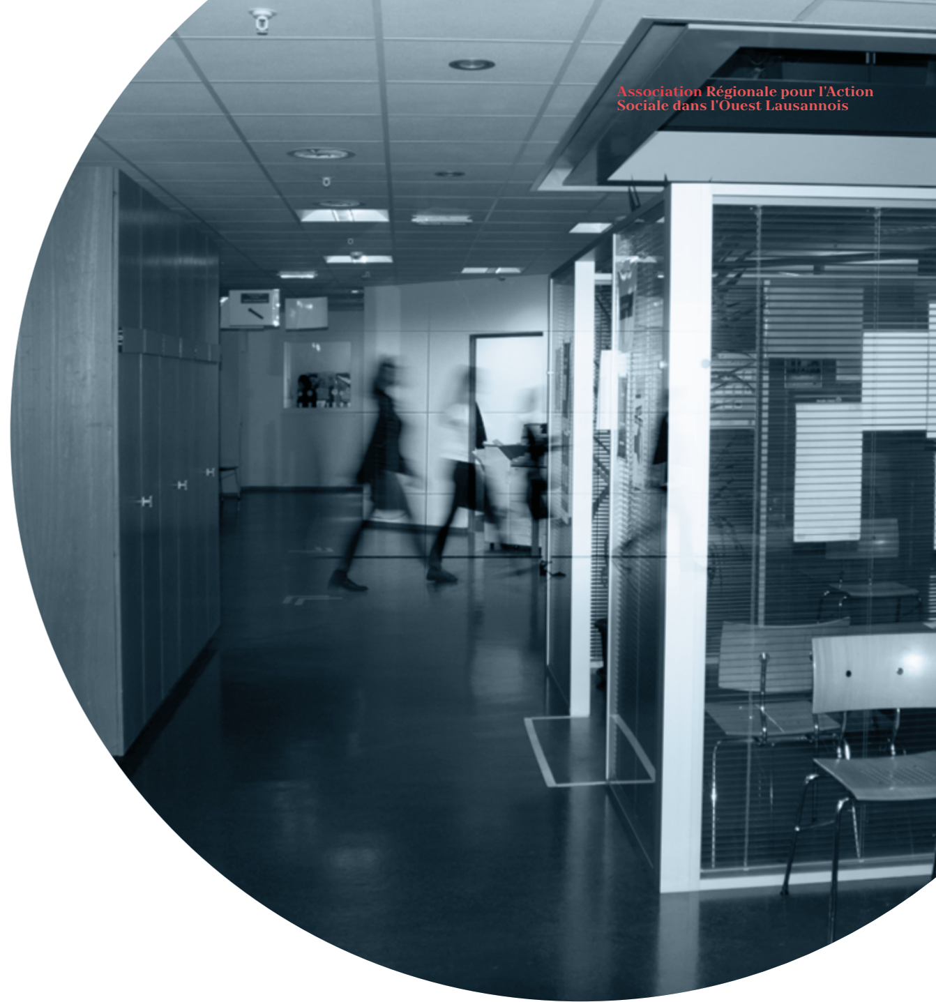
Association Régionale pour l'Action Sociale dans l'Ouest Lausannois