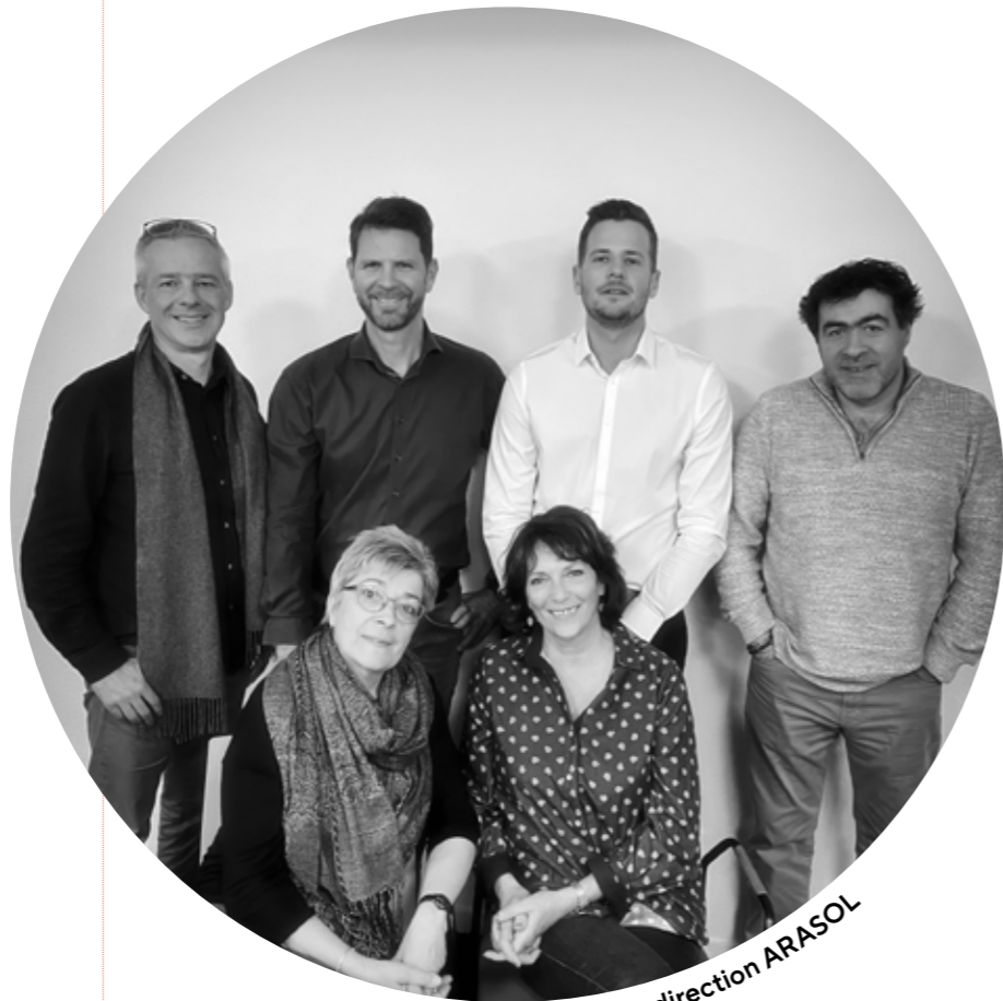
Collège de direction ARASOL